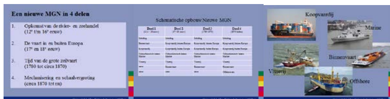
De opzet van de Nieuwe Maritieme Geschiedenis van Nederland.

Het ‘product’ dat zal worden opgeleverd in 2019-2020/1 is de volledige, integrale, digitale en rijk geïllustreerde tekst van de NMGN. De digitale publicatie wordt in 2019-2020/1 volledig ingebed in het Maritiem Portal.